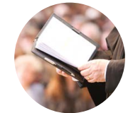
Projektjahr mit Gottesdienstcoach